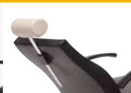
short, adjustable, detachable