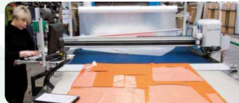
CNC-Zuschneiden CNC cutting

Alle abgebildeten Produkte wurden von Matthias Ebert, Stuttgart gestaltet. All products shown were designed by Matthias Ebert, Stuttgart.