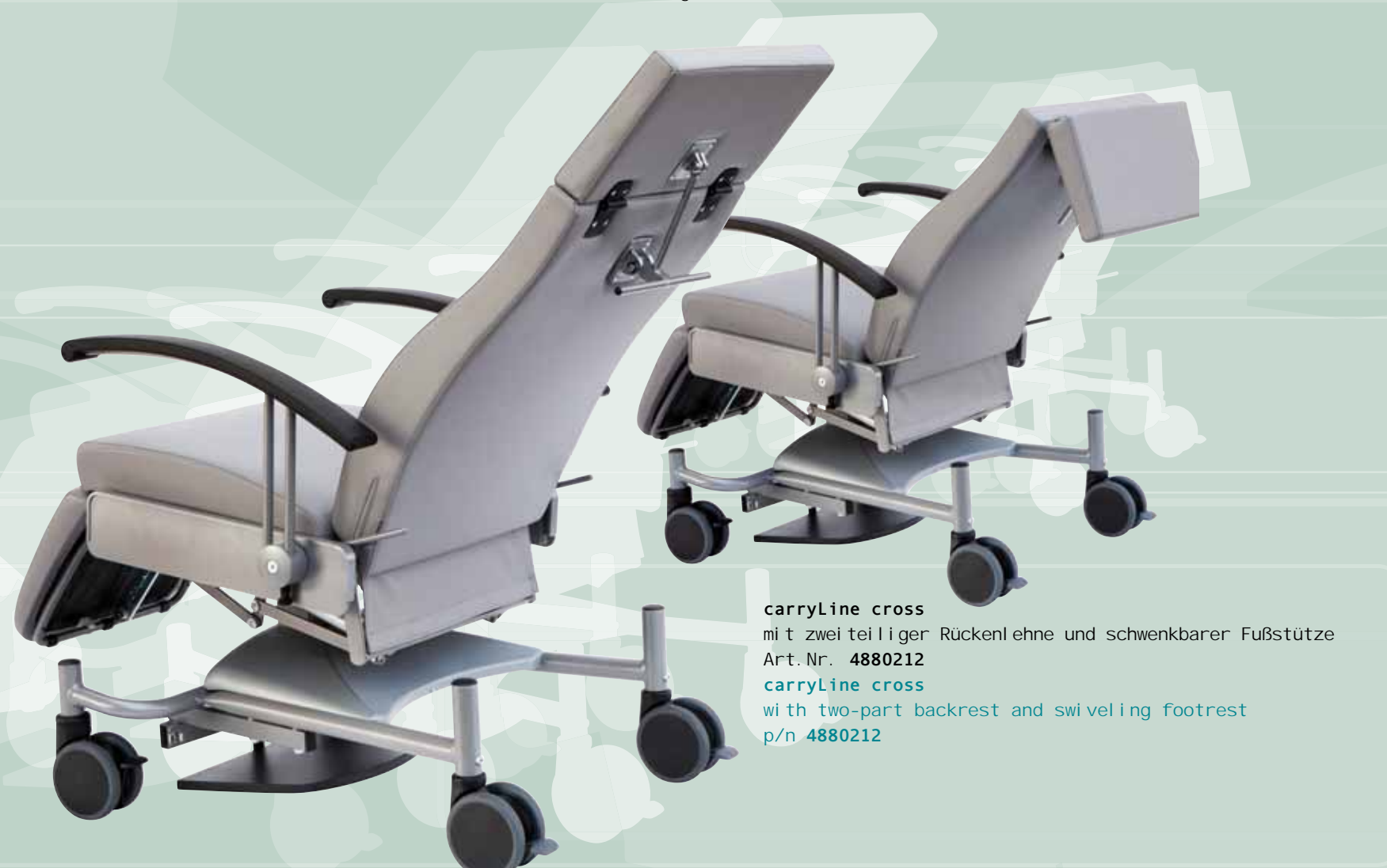
carryLine cross mit zweiteiliger Rückenlehne und schwenkbarer Fußstütze Art. Nr. 4880212 carryLine cross with two-part backrest and swiveling footrest p/n 4880212

Das Fahrwerk der carryLine cross ist auf engem Raum sehr beweglich. Die beiden vorderen Doppellaufrollen lassen sich in Fahrtrichtung feststellen und stellen so den Geradeauslauf sicher. Alle 4 Rollen haben einen Durchmesser von 125 mm und einen Totalfeststeller. Die Sitz-/Liegehöhe beträgt 51 cm. Die Armlehnen lassen sich nach hinten abschwenken und ermöglichen einen seitlichen Ein- und Ausstieg in/aus dem Stuhl.