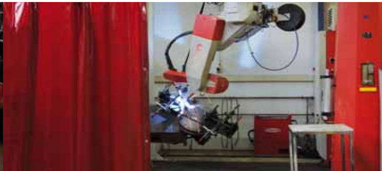
CNC-Schweißen CNC welding