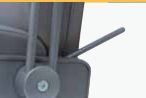
back- and legrest adjustment manually