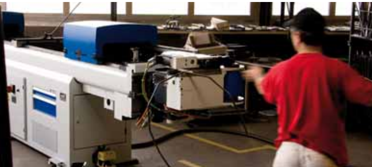
CNC-Biegen CNC bending