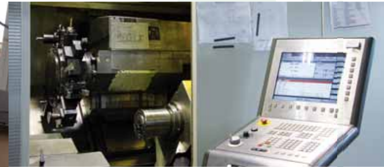
CNC-Drehen CNC lathing