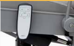
back- and legrest adjustment electrically