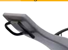
backrest one-part, handle