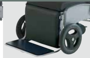
footrest adjustable, detachable mobil/mobil hv